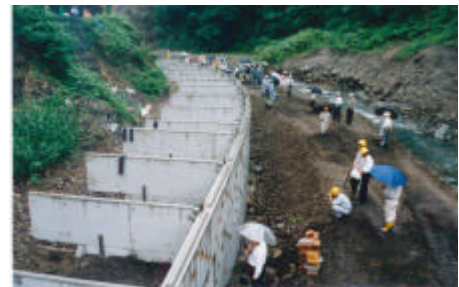
写真 - 1