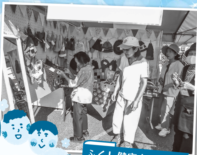
ふくし健康まつり つながる関係づくり