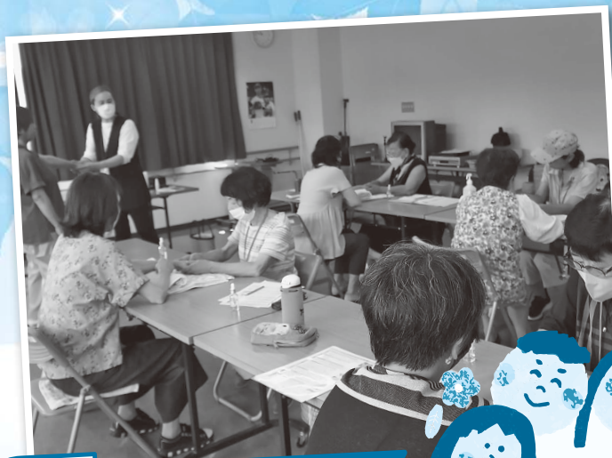
ボランティア講座 ～みんなでアロマハンドマッサージ～ ふれあう人づくり