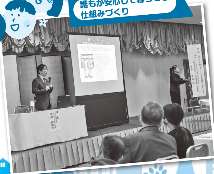
え-まち講演会 誰もが安心して暮らせる 仕組みづくり

★事業を一部紹介しています。 詳しい内容や参加申込に関して は、お電話やホームページ でご確認ください。