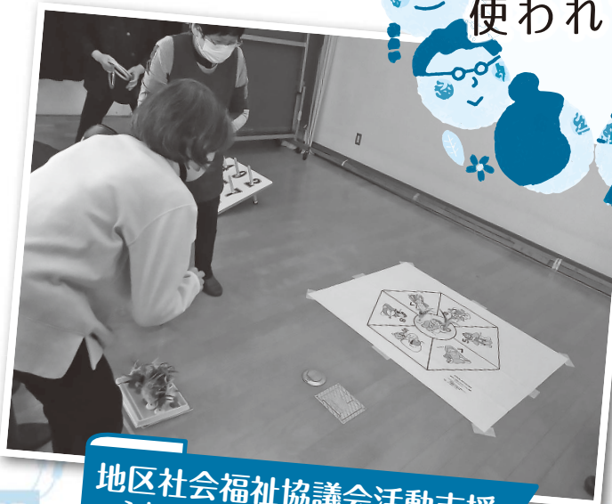
地区社会福祉協議会活動支援 ～ふれあいサロン活動～ 支え合う地域づくり