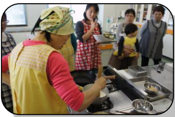
ミルクくずもち調理中

次に、4種類のおやつ作り方の説明をしながら調理をしていただき、その後班に分かれて調理し、子どもさんを交えて会食をしました。